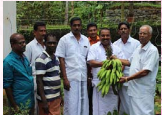
മുളങ്കുഴിയിൽ ഉത്പാദിപ്പിച്ച വാഴക്കുലകളുടെ വിളവെടുപ്പ്